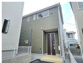
*クレイドルガーデン豊見城市嘉数 第6 全5棟*