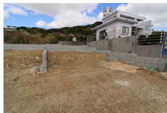
*クレイドルガーデン南城市玉城前川第1 全5区画*