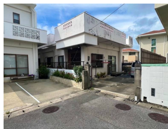
駐車場あり 駐車場2台以上