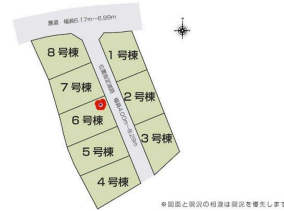
※図面と現況の相違は現況を優先します。