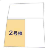
タクトホーム(株)那覇店