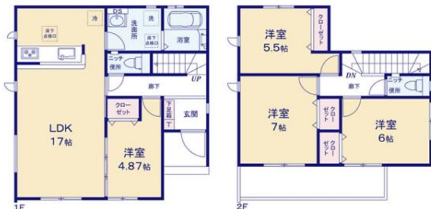
タクトホーム(株)那覇店