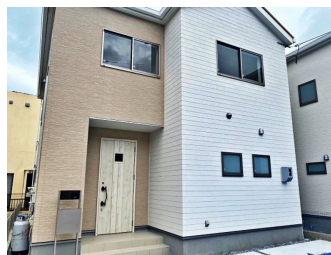
一建設(株) 沖縄営業所