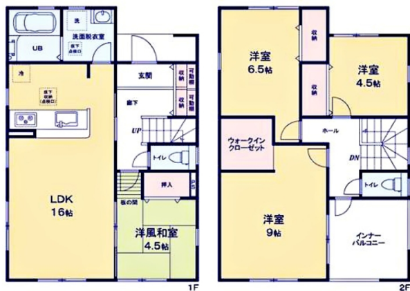
一建設(株) 沖縄営業所