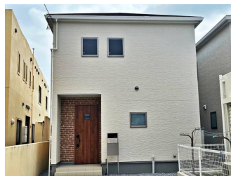
一建設(株) 沖縄営業所