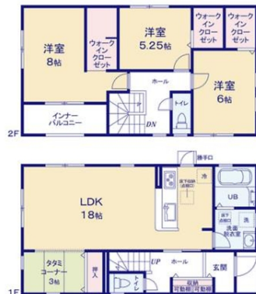
一建設(株) 沖縄営業所