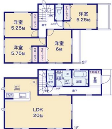
タクトホーム(株) 那覇店