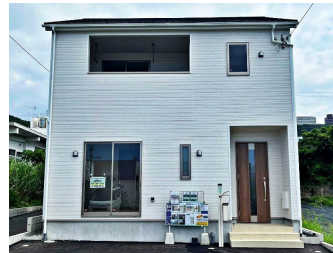
(株)アーネストワン 那覇営業所