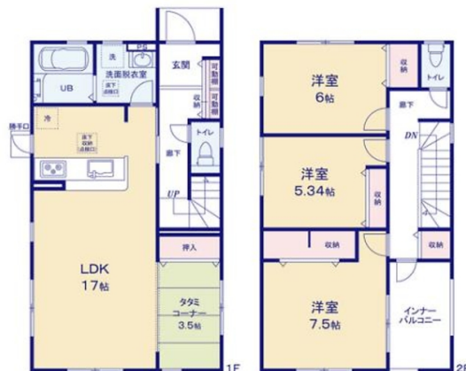
一建設(株) 沖縄営業所