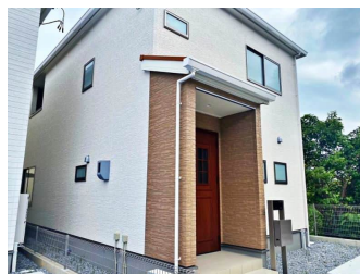
一建設(株) 沖縄営業所