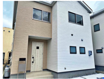
一建設(株) 沖縄営業所