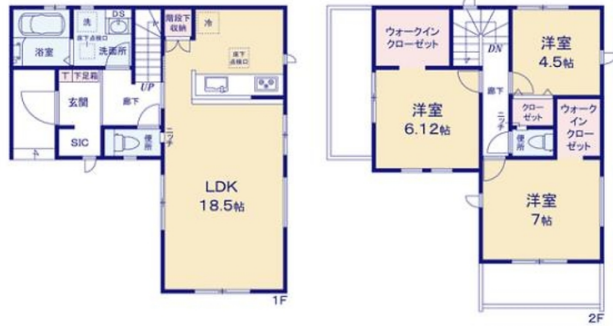
※SIC・シューズインクローゼット