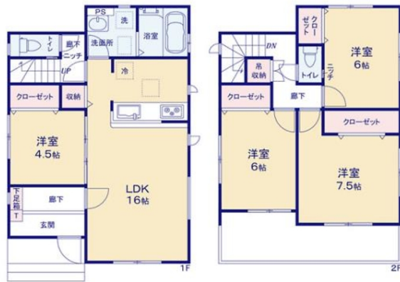
タクトホーム(株) 那覇店