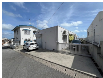
駐車場あり 駐車場2台以上