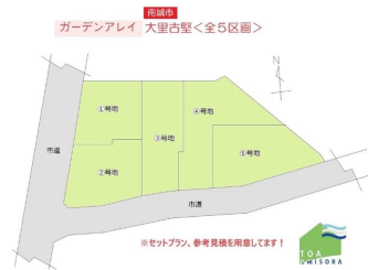
1F 大里古堅③号棟 2F

2階以上 バリアフリー ルーフバルコニー 制震/免震構造 駐車場あり 駐車場2台以上