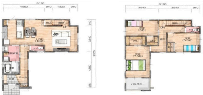
1F 大里古堅④号棟 2F