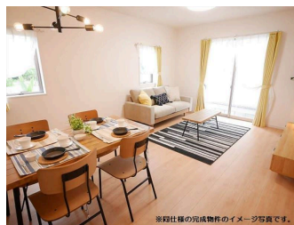
※同社様の完成物件のイメージ写真です。

2階以上 南向き 角地 バリアフリー ルーフバルコニー 庭付き 駐車場あり 駐車場2台以上 二輪車用駐車場