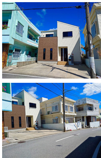
2階以上 駐車場あり