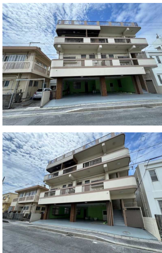
2階以上 駐車場あり