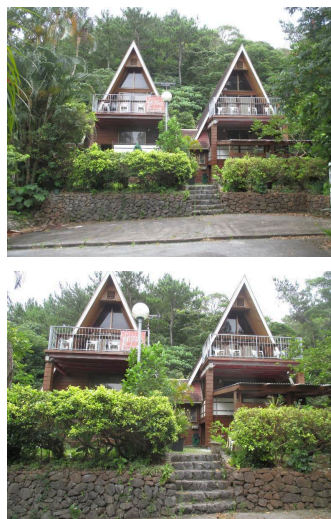
2階以上 庭付き 駐車場あり