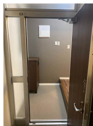
南向き 角地 駐車場あり