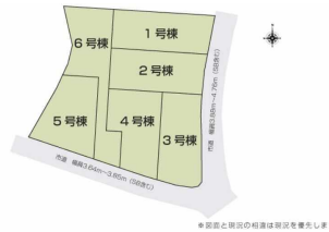
※図面と現況の相違は現況を優先します。