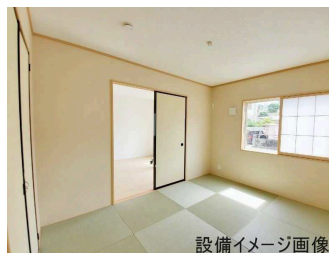
設備イメージ画像