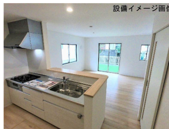
設備イメージ画像