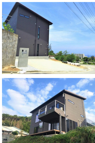
庭付き 駐車場あり