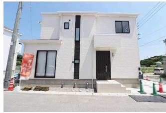
*ハートフルタウン南城市大里稲嶺II(全10棟)*