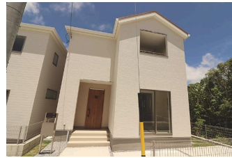
*南城市大里高平第2 全6棟*