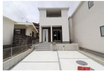
*南城市大里高平第3 全3棟*