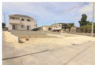
*南城市知念知名 全3棟*