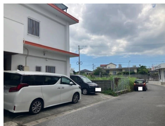
2階以上 駐車場あり