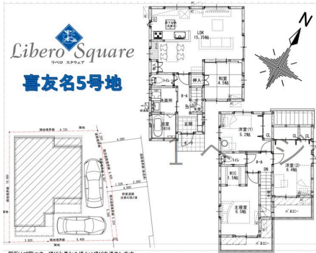
図面は縮図です。現状と異なる場合は現状を優先します。