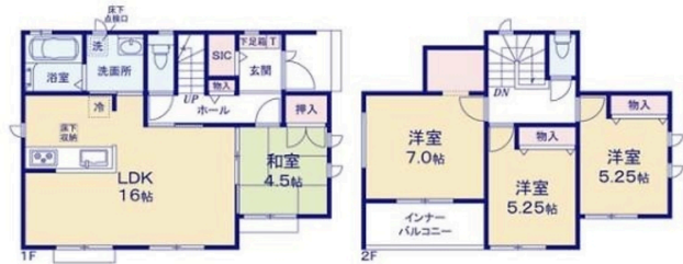
※SIC=シューズインクローゼット