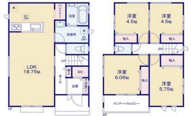
※SIC=シューズインクローゼット