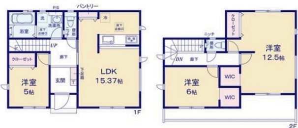
※WIC:ウォークインクローゼット