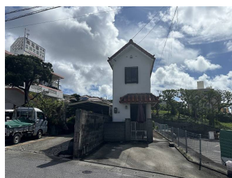
2階以上 駐車場あり