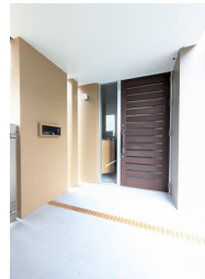
2階以上 二世帯向き 駐車場あり