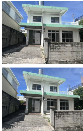
2階以上 駐車場あり