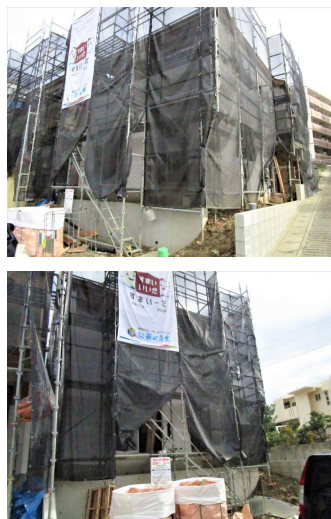
2階以上 駐車場あり 駐車場2台以上