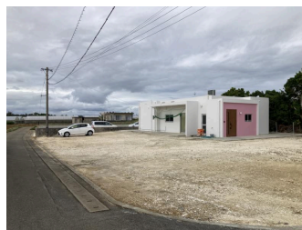
駐車場あり 駐車場2台以上