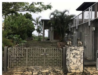
駐車場あり 駐車場2台以上