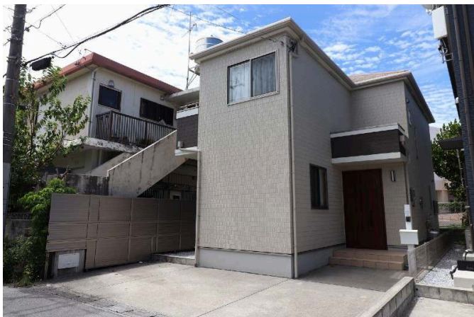
2階以上 駐車場あり

掲載中の写真に家具什器等がある場合、販売価格に含まれません。 眺望等は、天候等により変化します。また永続的に保証するものではありません。 室内写真の一部は、現況写真と間取り図面をもとにCGで作成したリフォームイメージです。 リフォーム費用は価格に含まれておりません。リフォームを行う場合は別途費用が発生します。