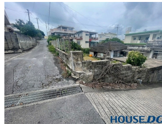
駐車場あり 駐車場2台以上