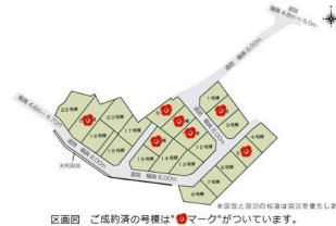
区画図 ご成約済の号楼は*マークがついています。