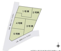
※図面と現況の相違は現況を優先します。