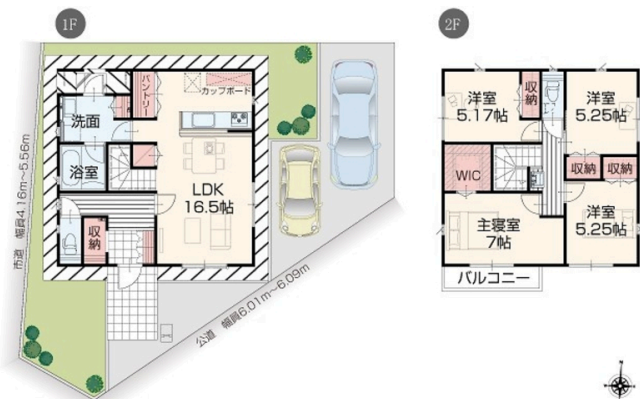
※図面と現況の相違は現況を優先します。