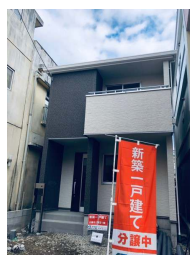
2階以上 駐車場あり