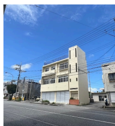
2階以上 駐車場あり