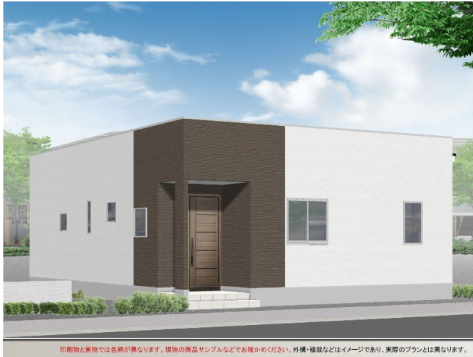
印刷物と実物では色納が異なります。現物の商品サンプルなどでお確かめください。外構・植栽などはイメージであり、実際のプランとは異なります。