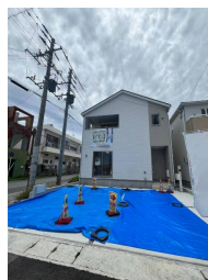
2階以上 駐車場あり