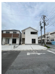
2階以上 駐車場あり