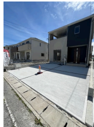
2階以上 駐車場あり